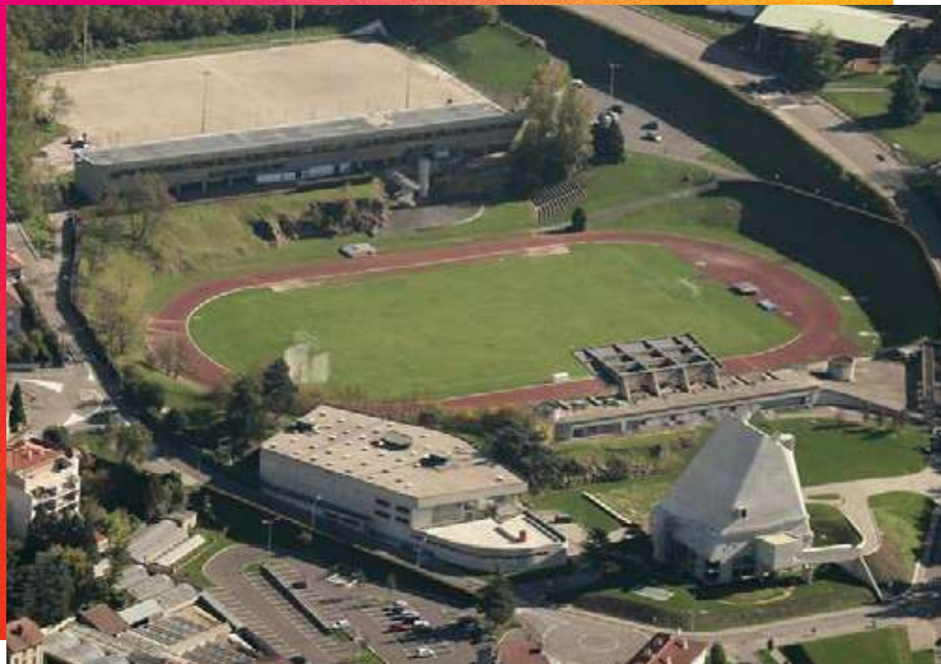
/ CENTRE CULTUREL ET SPORTIF

carrière. Le Corbusier conçoit une façade inclinée en porte-à-faux au-dessus du Stade. La toiture courbe est composée de dalles de béton cellulaire posées sur 132 câbles : une architecture inédite à l'époque. La distribution interne occupe trois niveaux. On y visite l'espace d'accueil, une salle de spectacle, un auditorium/salle de projection, deux salles d'exposition, un foyer-bar et une « rue » d'exposition. À l'étage, les bureaux du Service Culture de la Ville voisinent avec une salle de danse et une salle d'arts plastiques.