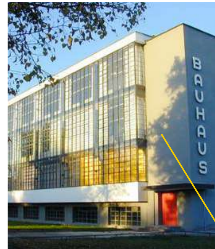
/ LE BAUHAUS, DESSAU, ALLEMAGNE

Les idées de Le Corbusier sur « la machine à habiter », les « maisons en série » ou « l'immeuble villa », se rapportent à un courant exprimé en 1927, lors du projet d'exposition Die Wohnung, au Weissenhof près de Stuttgart. L'ambition qu'il met dans la réalisation de ce qui est pour lui un