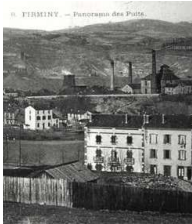
/ CARTE POSTALE PANORAMA DES PUIITS, FIRMINY

Au début du XIX ème siècle, Firminy compte 1 800 habitants. Dans les années cinquante, la population est passée à 20 000 habitants.