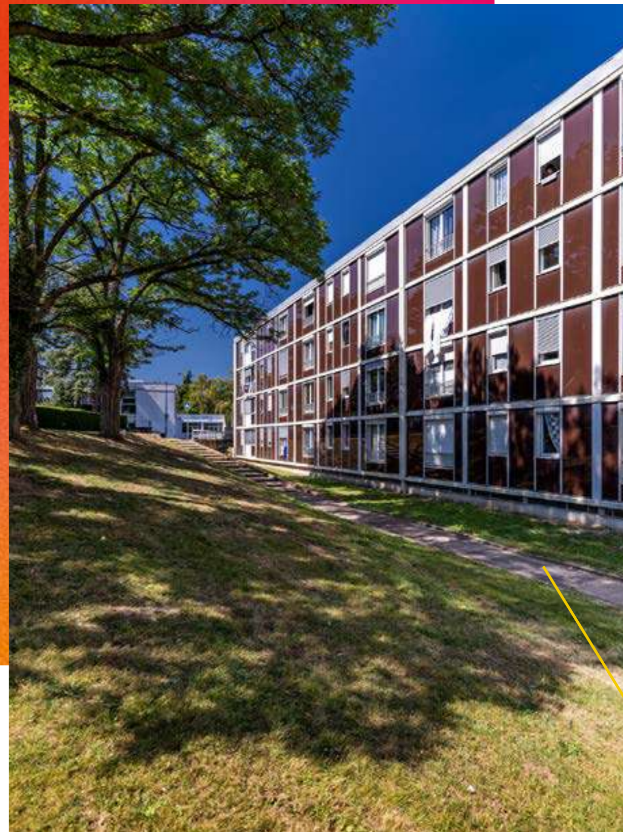
/ QUARTIER DE FIRMINY-VERT

Récompensé du Grand Prix National d'Urbanisme 1961, le quartier est aujourd'hui encore protégé en tant que Site Patrimonial Remarquable (SPR).