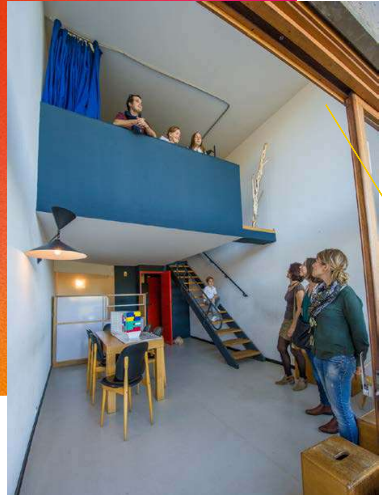
/ UNITÉ D'HABITATION, APPARTEMENT-TÉMOIN