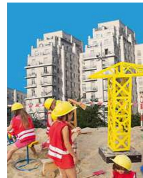
/ GRATTE-CIEL DE VILLEURBANNE, 'VILLEURBANNE À HAUTEUR D'ENFANTS'