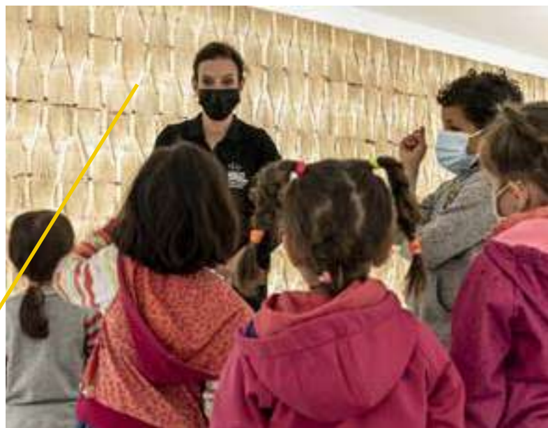
/ MAMC+, VISITE ENFANTS

Premier musée d'art moderne créé en région en 1987, il possède l'une des collections d'art moderne et contemporain parmi les plus importantes en France et l'une des quatre collections de design du pays. Ses expositions d'art contemporain vous invitent à découvrir la création d'aujourd'hui, avec des stars internationales ou de jeunes artistes.