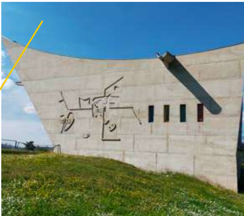
/ MAISON DE LA CULTURE, PIGNON SUD