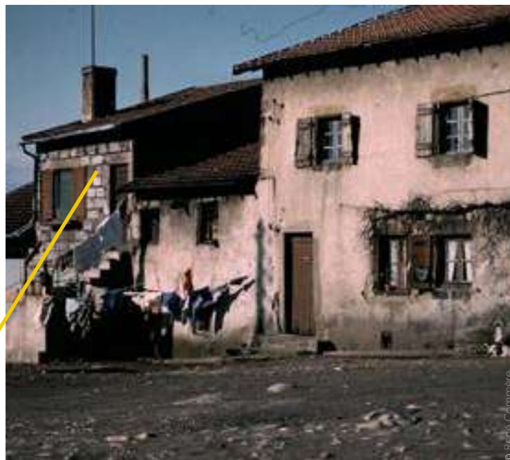
/ MAISON OUVRIÈRE DE FIRMINY

Dans certains quartiers, les logements sont insalubres, des familles entières habitent dans des espaces de 20 m 2 , parfois sans électricité et sans eau courante. Les écoles, les bibliothèques et équipements sportifs sont insuffisants.