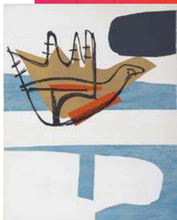
/ LE POÈME DE L'ANGLE DROIT, LA MAIN OUVERTE, LE CORBUSIER, 1955

Dès sa jeunesse, dans ses correspondances avec sa famille et ses maîtres à penser, Charles-Édouard Jeanneret écrit et théorise. A partir de 1918, il publie ses premiers textes au travers de la revue « l'Esprit Nouveau », dans laquelle il utilise des pseudonymes, dont celui de Le Corbusier.