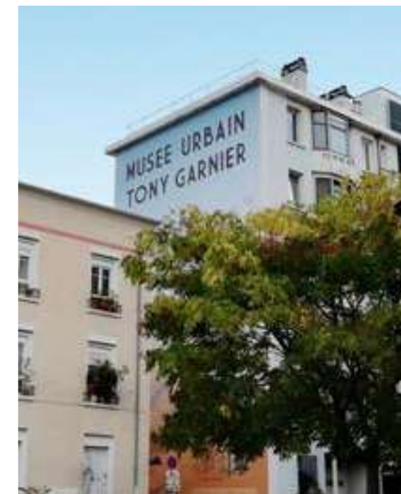
/ MUSÉE URBAIN TONY GARNIER À LYON

La Cité des Étoiles est une réalisation de l'architecte Jean Renaudie construite entre 1974 et 1981. Cet ensemble de logements se caractérise par une forme architecturale unique. Celle-ci traduit les préoccupations de l'architecte sur le logement et l'urbanisme, pour lesquels il cherche à développer une alternative aux tours et aux barres.