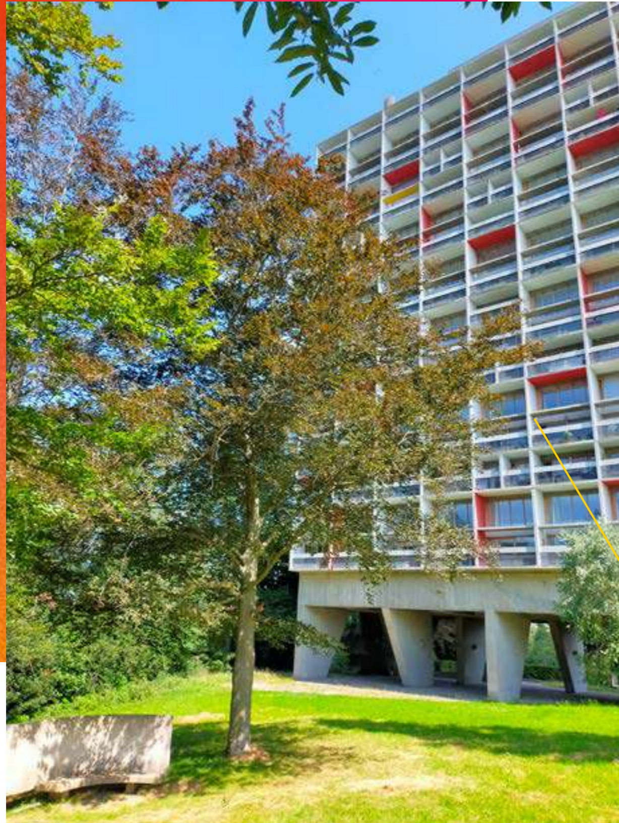
/ UNITÉ D'HABITATION, TOIT-TERRASSE