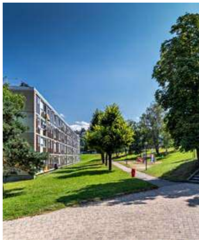
/ QUARTIER DE FIRMINY-VERT

S'inspirant des principes de la Charte d'Athènes, Firminy-Vert est un quartier construit en réponse aux besoins du corps, de l'âme et de l'esprit, dans un cadre où soleil, espace et verdure sont dominants. En faisant appel à l'urbanisme vertical, les architectes libèrent l'espace au sol. L'ensemble met en avant les fonctions de la ville « habiter, travailler, circuler et