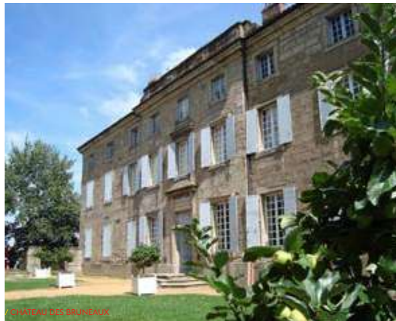
/ CHÂTEAU DES BRUNEAUX

+ d'infos sur l'offre couplée : scolaires@sitelecorbusier.com