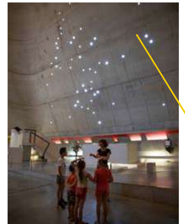
/ ÉGLISE SAINT-PIERRE DE FIRMINY-VERT, NEF

politiques et financières, l'église est finalement terminée en 2006. Propriété de Saint-Étienne Métropole, l'édifice est devenu en partie un lieu d'exposition.