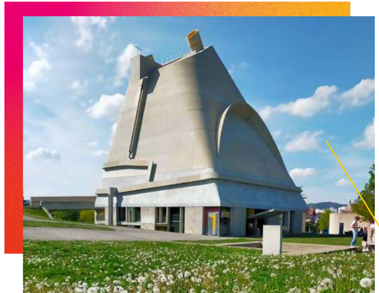
/ ÉGLISE SAINT-PIERRE DE FIRMINY-VERT