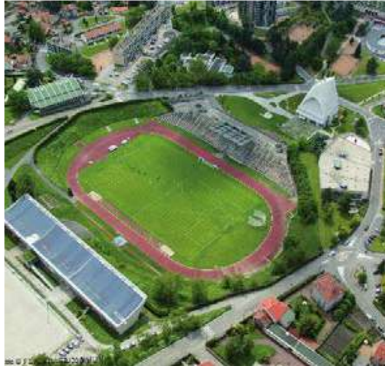
/ SITE LE CORBUSIER DE FIRMINY-VERT

Visiter le Site Le Corbusier de Firminy, c'est s'embarquer dans un voyage d'étonnement et d'émotions, à la découverte d'un monde architectural inattendu. Une expérience hors du temps qui éclaire nos manières de vivre et interroge l'avenir.