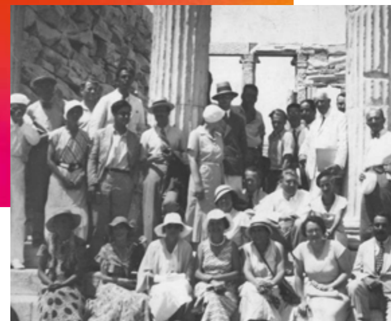
/ PARTICIPANTS LORS DU CIAM IV À ATHÈNES, 1933

projet d'envergure planétaire sera à l'origine de l'organisation des C.I.A.M. (Congrès Internationaux d'Architecture Moderne) dès 1928.