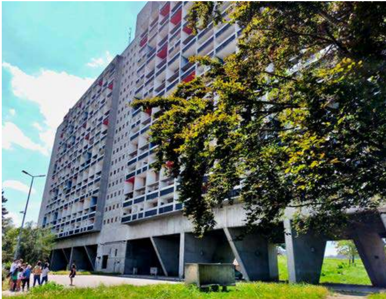
/ UNITÉ D'HABITATION DE FIRMINY

Entre 1952 et 1967, cinq Unités furent réalisées : Marseille (13), Rezé-les-Nantes (44), Briey-en-Forêt (54), Berlin (Allemagne), et Firminy (42).