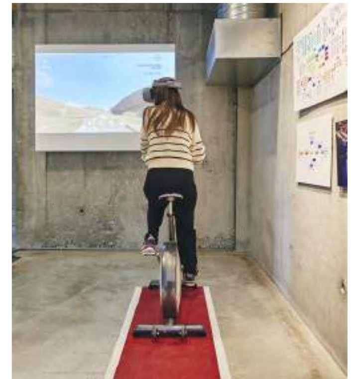
Exposition Ça bouge en ville ! Sport et architecture pour demain

Réservation obligatoire par mail : scolaires@sitelecorbusier.com