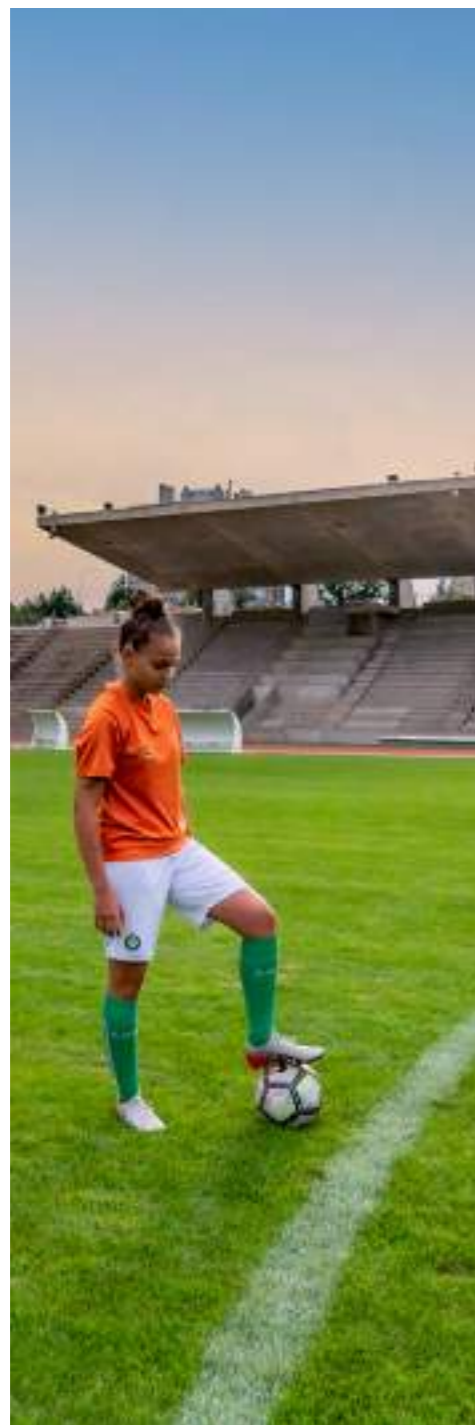
Stade Le Corbusier

Ce programme de visites est transdisciplinaire : avec un guide ou en autonomie, les élèves sont amenés à réfléchir à la notion de sport, de design actif et d'architecture.