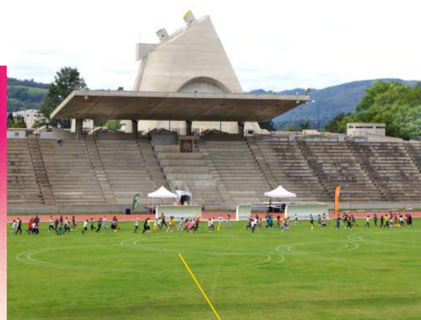
Cross scolaire - septembre 2022