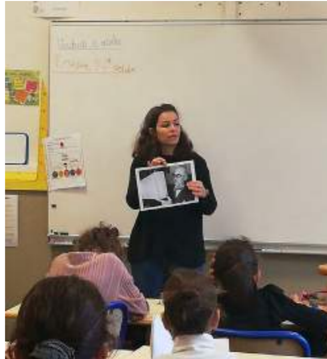
Intervention en classe - JNA 2022

Sur inscription par mail : scolaires@sitelecorbusier.com