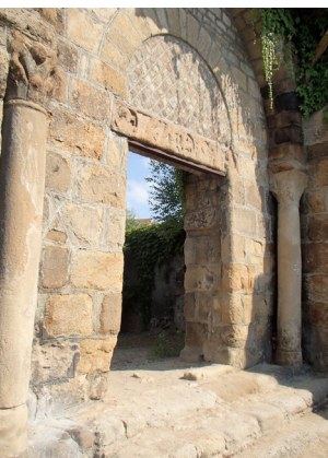
Porte Saint-Pierre

Abrité dans un château du XVIII e siècle (Monument historique), l'écomusée, géré par la Société d'Histoire de Firminy, permet la découverte des différents patrimoines appelés.