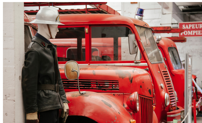
Musée des sapeurs pompiers de la Loire