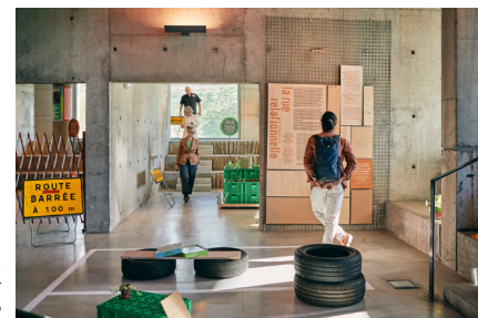
Exposition La rue des transitions © Pierre Desrumeaux – Studio NORDE Site Le Corbusier © FLC/ADAGP

> Dimanche 14h-18h : Costanza Matteucci, l'une des deux commissaires de l'exposition. Découvrez l'expo avec celle qui l'a créée !