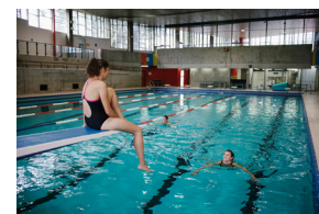
Piscine André Wogensky

Visite guidée et présentation des travaux effectués et à venir de cette piscine, conçue et réalisée par André Wogensky, inscrite à l'inventaire supplémentaire des Monuments historiques et encore aujourd'hui utilisée en tant que piscine municipale. Sur inscription : 04 77 61 08 72