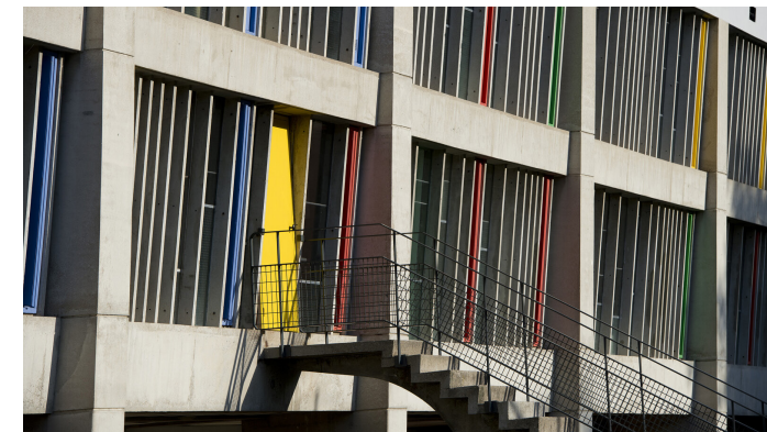
Maison de la Culture - Jean-Jacques Gelbart © FLC/ADAGP

Découvrez cet édifice phare de l'architecture de Le Corbusier, inscrit sur la liste du Patrimoine mondial de l'Humanité par l'Unesco. Profitez d'un moment de détente : le foyer-bar de la Maison de la Culture est ouvert tout le week-end de 13h30 à 18h, au profit de l'association Aya Seniors.