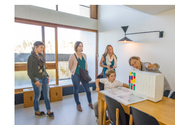
Appartement-témoin de l'Unité d'Habitation. Luc Olivier © FLC/ADAGP