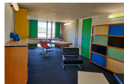
Bureau et mobilier Pierre Guariche - Site Le Corbusier © FLC/ADAGP

Le service des Archives municipales de Firminy vous accueille dans un bureau ayant conservé l'intégralité de son mobilier Pierre Guariche des années 1960, ouvert exceptionnellement à la visite. Venez découvrir le métier d'archiviste, à la croisée des chemins entre histoire et droit. Vous y découvrirez les enjeux et les techniques de préservation du patrimoine Appelou.