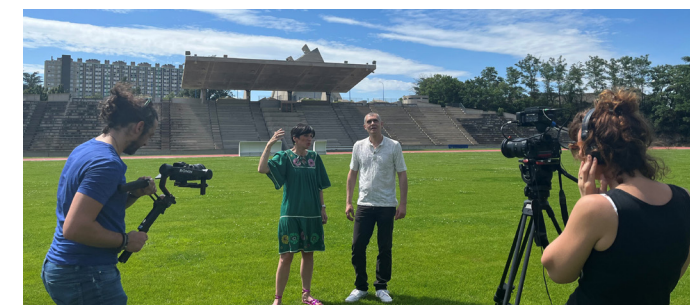
Stade Le Corbusier - © FLC/ADAGP

pour découvrir si le Site Le Corbusier de Firminy remportera le titre tant convoité de Monument préféré des Français !