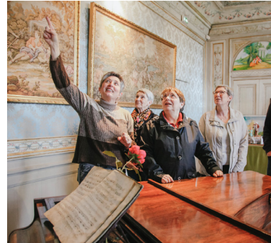
Écomusée des Bruneaux